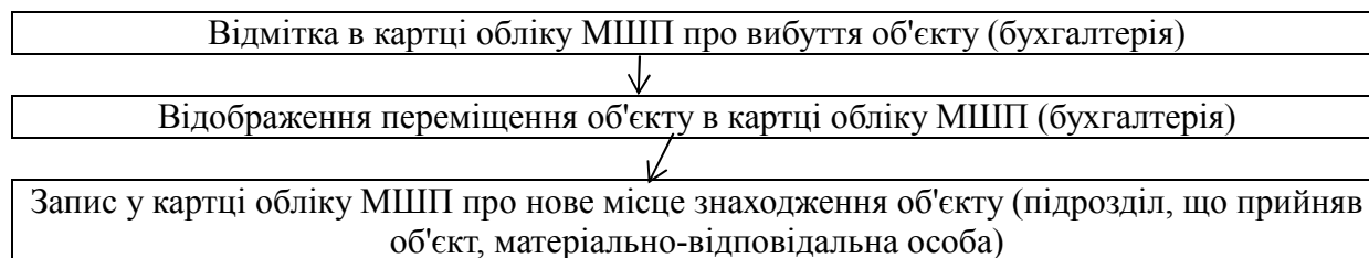
Рис. 3. Послідовність документообігу при внутрішньому переміщенні об'єкту МШП*

Схема документообігу по внутрішньому переміщенню об'єкта МШП на підприємстві наведена на рис. 3.