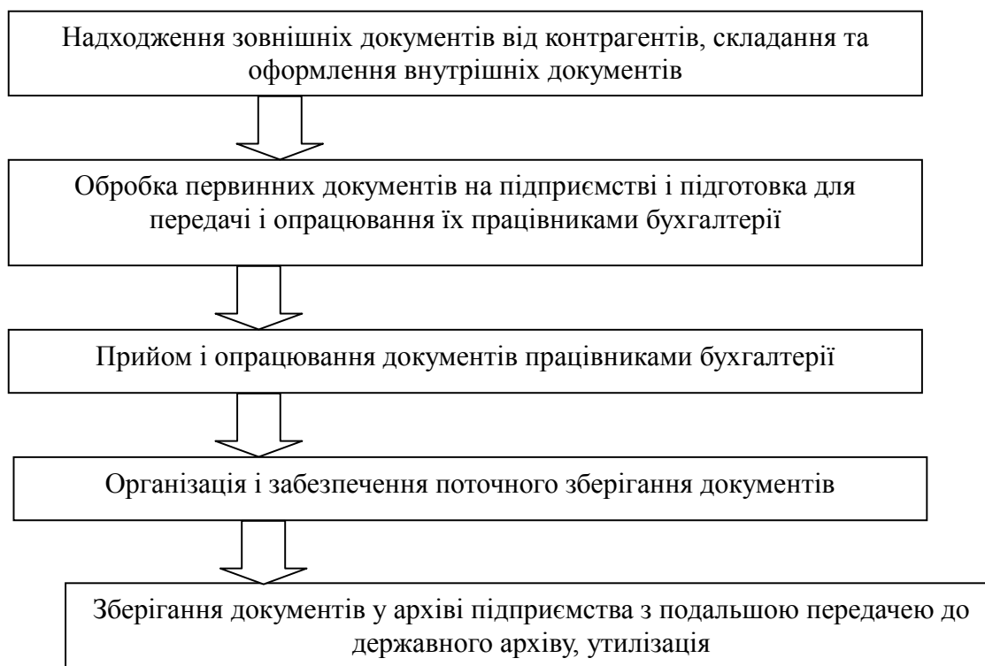
Рис. 1. Загальна схема організації документообігу на підприємстві*

На кожному робочому місці бухгалтерський документ повинен знаходитися мінімальний строк і проходити якомога менше інстанцій. Прискорення документообігу покращує якість облікової інформації і забезпечує достовірність показників господарсько-фінансової діяльності підприємства. Загальна схема організації документообігу на підприємстві представлена на рис. 1.