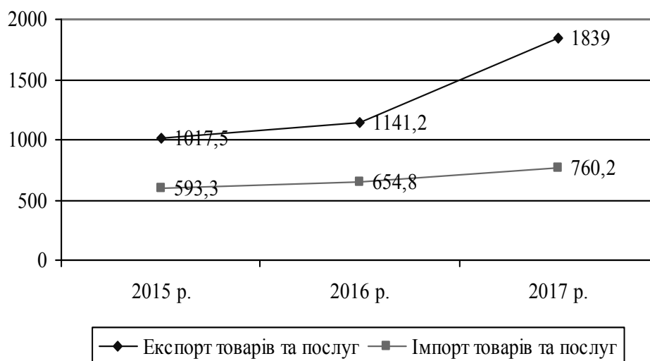
Рис. 1. Динаміка зовнішньої торгівлі товарами та послугами України з Нідерландами за 2015-2017 рр., млн.дол.США

Сучасний розвиток торгівлі між Україною та Нідерландами демонструє швидке зростання експорту товарів та послуг з України до Нідерландів, шляхом використання своєї специфічної структури експорту та ефект девальвації, та поступове зростання нідерландського імпорту до України через несприятливі умови для попиту на нідерландські товари (рис.1). [2]