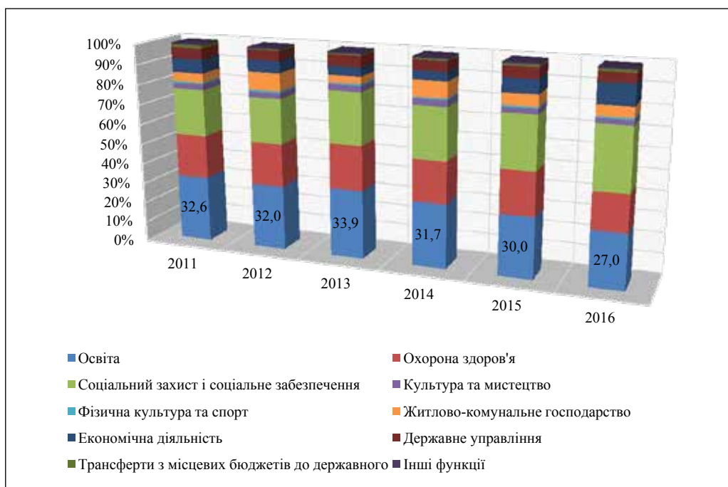
Рис. 2. Структура видатків місцевих бюджетів за функціональною класифікацією за 2011–2016 роки [4]

їни за 2011–2016 рр. займають соціальні видатки, зокрема, видатки на освіту – 27,0%, охорону здоров'я – 18,0%, соціальний захист і соціальне забезпечення – 30,4%, найменшу – видатки на житлово-комунальне господарство – 5,0%, культура та мистецтво – від 2,4%, фізична культура та спорт – 0,9% усіх коштів місцевих бюджетів України.