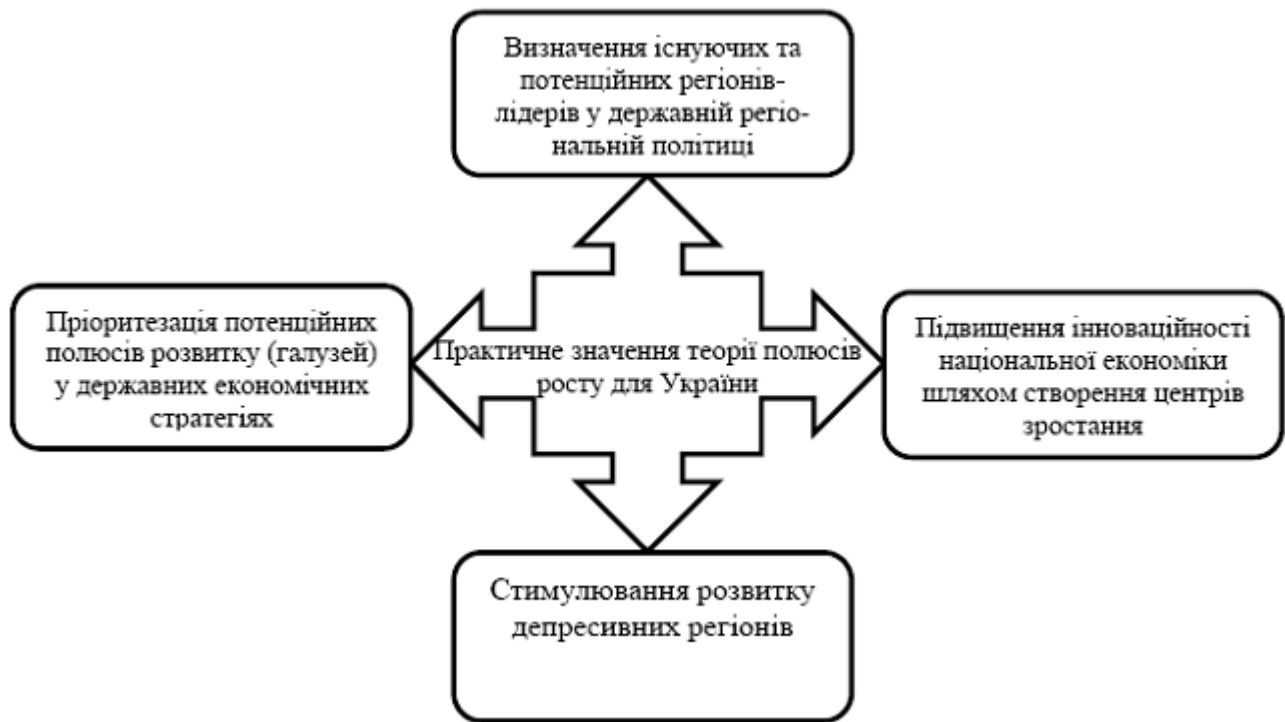
Рис. 2. Практичне значення теорії полюсів росту для України

Використання економічних полюсів як категорії, яка створює певну схему інтеграції, дозволило в розвинених країнах інституціалізувати функції держави у забезпеченні структурних зрушень. На їх основі стало можливим формування цілей розвитку регіонів і забезпечення умов їх досягнення. Цей аспект є надзвичайно важливим для економічного розвитку України, однією із найбільших проблем якої завжди була відсутність власної чіткої стратегії розвитку та стратегічних пріоритетів.