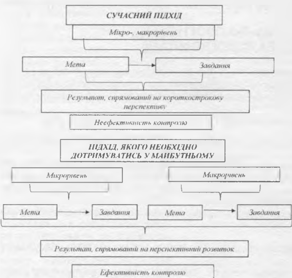
Рис. 2. Підходи щодо ефективності контролю в бюджетній сфері

Висновки з проведеного дослідження. Таким чином, контроль в бюджетній сфері можна аналізувати з таких позицій, як: кінцева стадія процесу управління; невід'ємна складова процесу прийняття і реалізації управлінських рішень; самостійна функція управління; процес забезпечення та досягнення цілей.