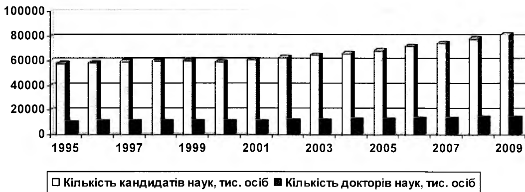
Рис. 2. Динаміка чисельності кандидатів та докторів наук, тис. осіб

Протилежною є динаміка чисельності кандидатів та докторів наук (див. рис. 2).