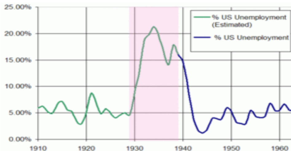
Рис.1. Безробіття у США в 1910–1960 рр.

Незабаром після приходу до влади президента Франкліна Рузвельта, в 1933 році, в американському конгресі був прийнятий закон (Закон Гласса-Стіголла (Glass-Steagall Act)), проект якого був ініційований демократами – Картером Глассом і Генрі Стіголлом.