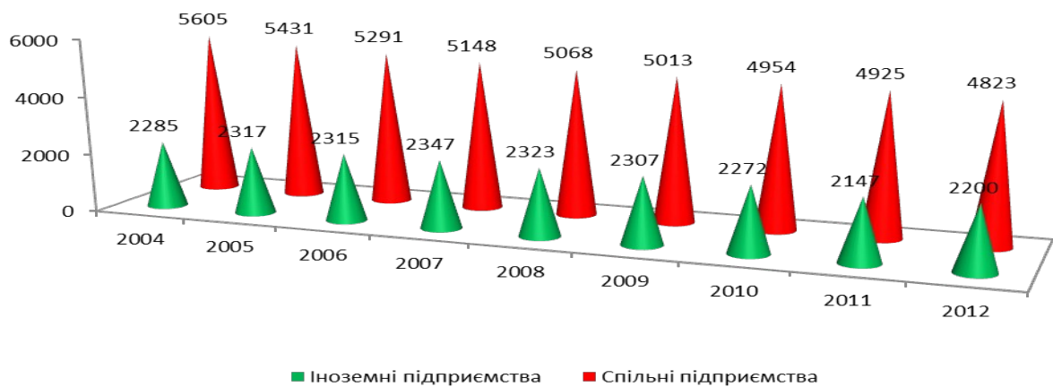
Рис.1. Кількість СП та іноземних підприємств, 2004-2012 рр.

Залученню іноземних інвестицій в українську економіку заважає кілька причин: нестабільність політичного становища в країні; економічна криза; зростання безробіття; високий рівень інфляції; слабка конвертованість національної валюти; тотальна корупція; рейдерство тощо [2].