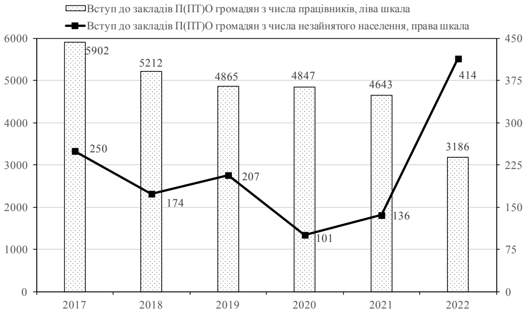
Рис. 3. Вступ до закладів П(ПТ)О громадян з числа незайнятого населення та працівників, осіб

які протягом 2022 року вступили до зазначених закладів (рис. 3, побудовано автором за даними державної статистичної звітності, форма № 3 (проф-тех), станом на 1 січня відповідного року).