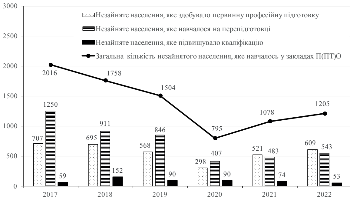
Рис. 2. Загальна кількість незайнятого населення, яке навчалось у закладах П(ПТ)О, усього та за формами навчання, осіб

За досліджуваний період після суттєвого (дво-триразового) зменшення кількості незайнятого населення, яке навчалось у закладах П(ПТ)О, у 2018–2020 роках роках відбулося поступове збільшення показників, особливо щодо осіб, які здобували первинну професійну підготовку (понад удвічі). Так, у 2022 році кількість осіб з числа незайнятого населення, що навчались у закладах П(ПТ)О, збільшилася на 11,8%, або на 127 осіб, проти попереднього 2021 року та на 51,6%, або на 410 осіб, – проти 2020 року. (рис. 2, побудовано автором за даними державної статистичної