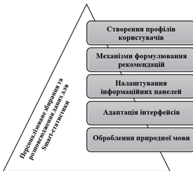
Рис. 5. Складові персоналізованого збирання та розповсюдження даних з допомогою алгоритмів машинного навчання

Малодослідженим для офіційної статистики, водночас цілком можливим для Smart-статистики є персоналізоване збирання та розповсюдження даних з допомогою технологій ШІ (рис. 5, авторська розробка) з метою адаптації цих даних і з огляду на конкретні потреби і вподобання окремих користувачів (або їх груп). Завдяки цьому підвищується доречність і зручність використання офіційної статистики та покращується допомога користувачам у частині прийняття більш обґрунтованих рішень на основі наявних даних.