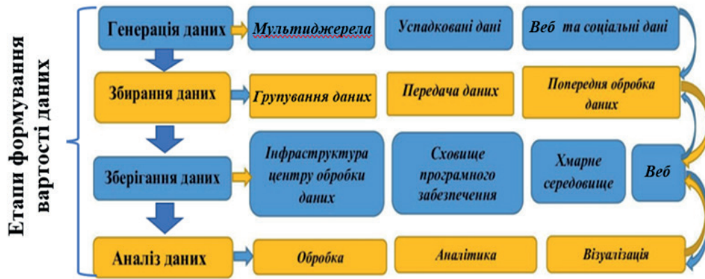
Рис. 2. Формування вартості даних: обов’язкові етапи та можливі складові

Схевенінгенським меморандумом 2013 р. про великі дані та офіційну статистику визначено, що великі дані – це явище, яке впливає на багато сфер політики [8]. У документі зазначається, що використання великих даних в офіційній статистиці вимагає нових розробок у методології, оцінці якості та питаннях, пов’язаних з ІТ. З-поміж іншого йдеться про те, що використання великих даних для статистичних цілей кидає виклик європейській статистиці, разом з тим великі дані слугують своєрідною системою для ефективного вирішення різноманітних проблем. Офіційна статистика повинна включати якомога більше всіх потенційних джерел даних, включаючи великі дані [8].