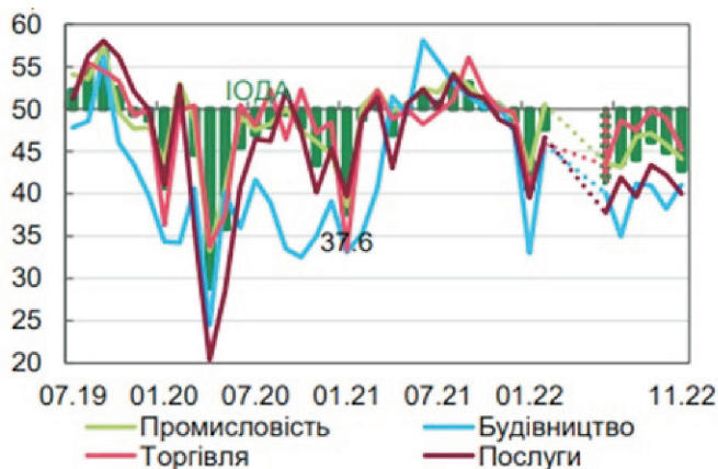
Рис. 2 Індекс ділової активності ВЕД