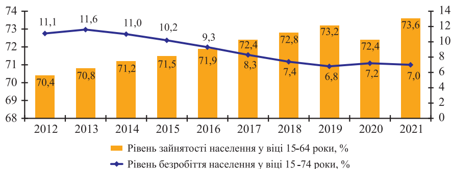
Рис. 2. Динаміка рівня зайнятості та безробіття населення в ЄС, 2012-2021 рр.

національному ринку праці. Адже, ринок праці ЄС демонструє чітку тенденцію щодо зростання рівня зайнятості та зниження рівня безробіття населення. Тобто, функціонування ринку праці України перебуває під впливом власних (відмінних від ринку праці ЄС) та переважно негативних соціально-економічних факторів. Дослідження розподілу безробітних за тривалістю пошуку роботи (рис. 3) свідчить, що на національному ринку праці частка безробітних, які здійснювали пошук роботи понад 6 місяців суттєво зросла, що є вкрай негативним. Адже, по закінченню саме шестимісячного терміну по припиненню трудової діяльності, відбуваються незворотні процеси, пов'язані з дискваліфікацією. На жаль, дані свідчать, що у 2021 р. кожен четвертий безробітний в Україні здійснював пошук роботи понад 12 місяців, тобто був охоплений хронічним безробіттям.