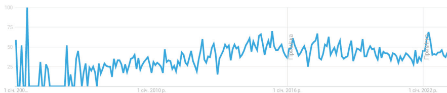
Рис. 2. Динаміка зміни частоти пошуку в розрізі категорії «інтегрована звітність» у світі згідно з Google Trends [1] за період 01 січня 2004 р. – 04 березня 2023 р.