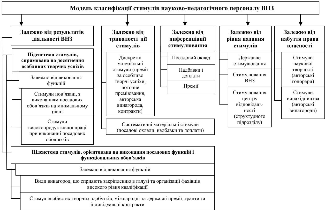
Рис. 2. Модель класифікації стимулів НПП ВНЗ

В основу формування дієвого механізму матеріального стимулювання праці в галузі освіти була покладена ринкова теорія заробітної плати. Серед загальних вимог до формування механізму матеріального стимулювання праці в науковій і науково-педагогічній діяльності, що враховують особливості змісту та результатів праці в даній сфері, слід виділити такі: орієнтація на результати роботи ВНЗ; узгодженість професійних інтересів НПП з потребами розвитку економіки та суспільства в цілому. Реалізація даних вимог зумовлена реаліями сьогодення і повинна знайти відображення в системі матеріального стимулювання наукової та науково-педагогічної праці.