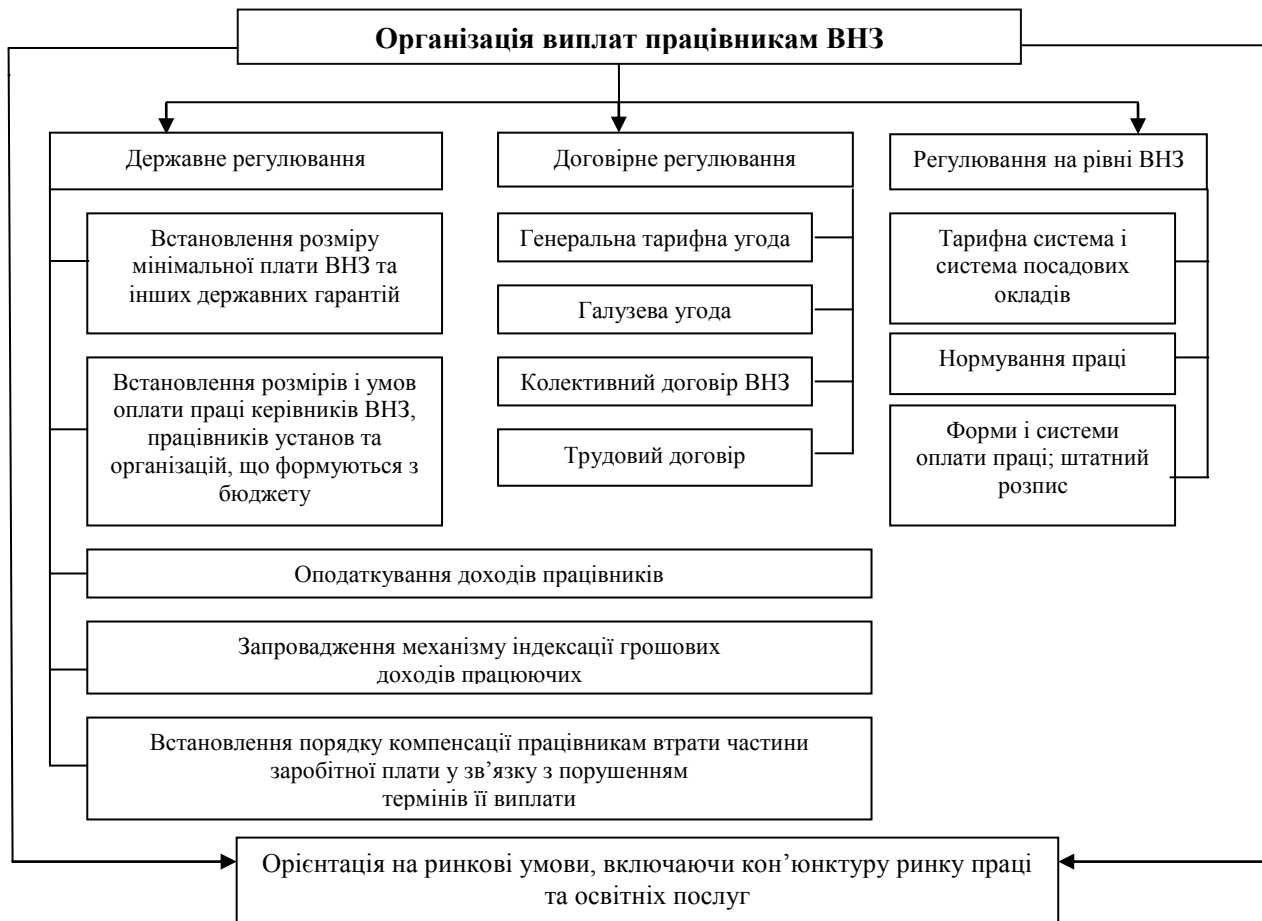
Рис. 1. Модель організації виплат працівникам ВНЗ в умовах ринкових відносин

Система перелічених елементів та відносин, що виникають у процесі їх взаємодії, складають економічний механізм стимулювання праці. Дослідження внутрішніх і зовнішніх чинників на видатки на оплату праці дозволили нам розробити модель організації виплат НПП ВНЗ з урахуванням специфіки джерел їх фінансового забезпечення (рис. 1). Розроблена модель зорієнтована на ринкові умови, включаючи кон'юнктуру ринку праці та освітніх послуг.