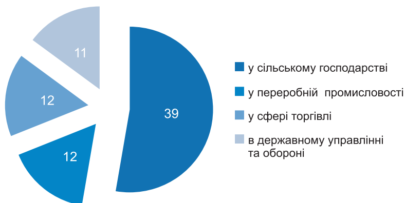
Рис. 3. Сфери діяльності зареєстрованих безробітних після повномасштабного вторгнення в Україну у травні 2022 року, %

Проте, сьогодні основу частину діяльності посідає сільське господарство – 39% (рис. 3), яке складає значний відсоток усієї структури зайнятості населення в порівнянні з 2021 роком, переробна промисловість та сфера торгівлі займають по 12%, галузь оборони та державного управління – 11%. Інші сфери діяльності охоплюють 26% від усієї структури зайнятості.