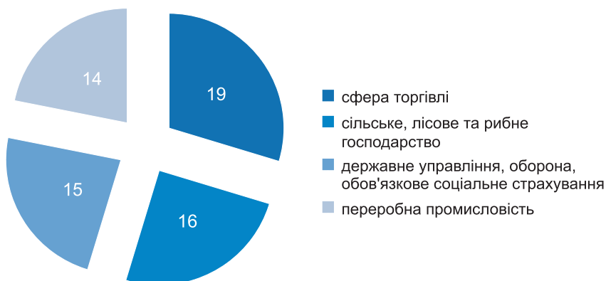
Рис. 2. Сфери діяльності зареєстрованих безробітних до початку повномасштабної війни в Україні у 2021 році, %