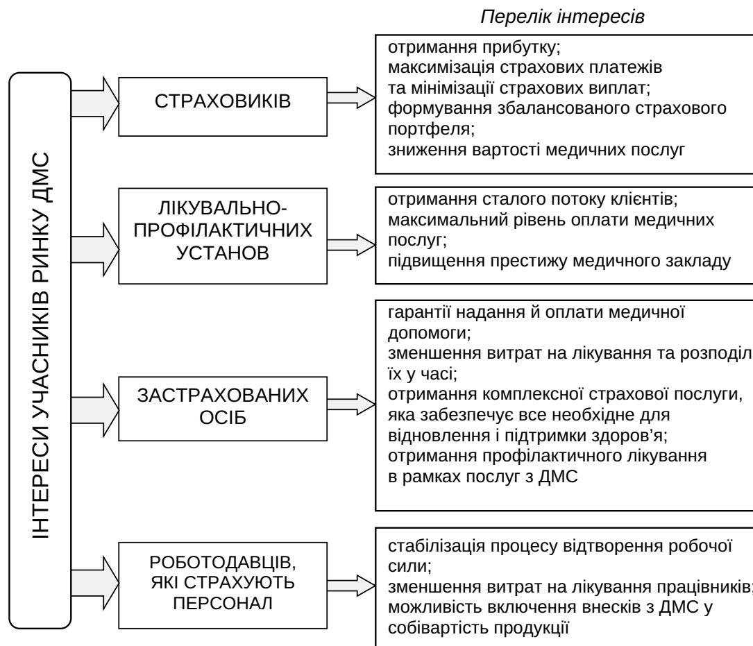
Рис. 3. Економічні інтереси учасників ринку ДМС