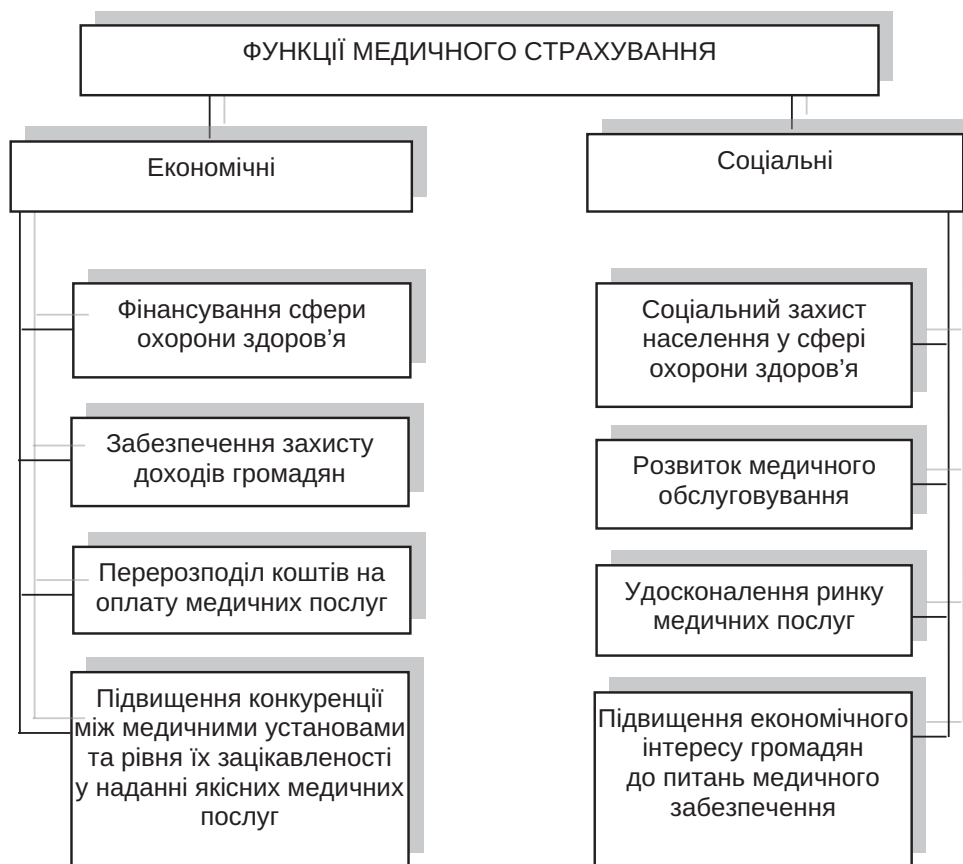
Рис. 1. Функції медичного страхування

Однією з основних серед цих причин була недостатність суми страхових зборів як джерела фінансування системи охорони здоров'я для ефективного запровадження обов'язкового медичного страхування. Сьогодні в Україні