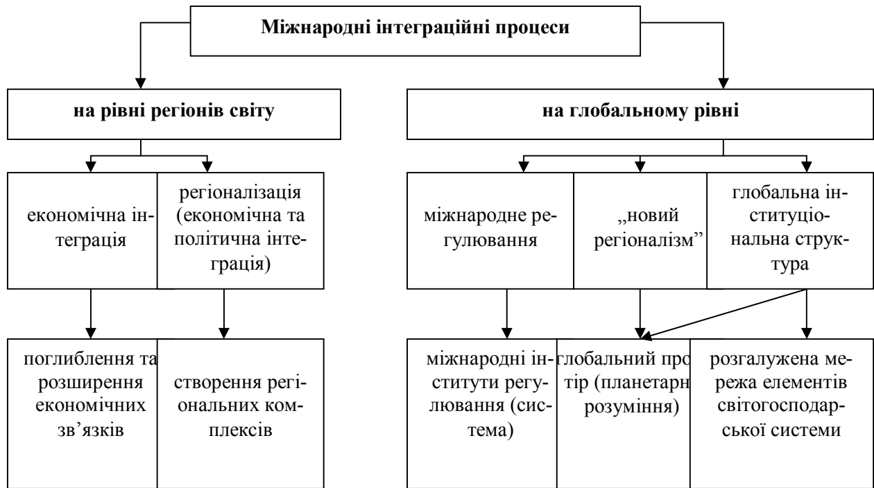
Рис. 1 Співвідношення глобалізаційних та інтеграційних тенденцій [1]

жав, формування і розвитку економічних зв'язків і контактів між ними в рамках і межах юридичних повноважень. Саме такий регіоналізм підпадає під визначення всіх видів взаємодій з перетином державних кордонів між суб'єктами, що базуються в межах певної території.