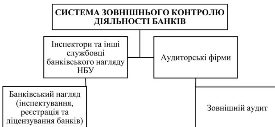
Рис. 1. Система зовнішнього контролю діяльності банківської установи

Контроль за діяльністю банківських установ в Україні поділяється на зовнішній та внутрішній. Зовнішній контроль у банків здійснюється Національним банком України і незалежними аудиторськими фірмами (рис. 1). Даний контроль містить систему банківського нагляду та регулювання з боку Національного банку України та зовнішній аудит [4, с. 174].