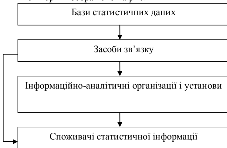
Рис. 1. Принципова схема статистичного моніторингу

Виклад основного матеріалу. Схематично статистичний моніторинг зображено на рис. 1