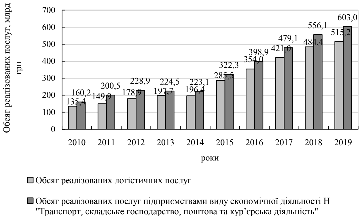
Рис. 1. Динаміка обсягу реалізованої продукції підприємствами ринку логістичних послуг за 2010-2019 рр., млрд грн

Світова практика оцінки розміру ринку логістичних послуг дозволяє дослідити даний ринок в Україні через обсяг послуг, що були реалізовані споживачам підприємствами виду економічної діяльності секції Н, зокрема груп Н49.2, Н49.4; Н49.5; Н50.2; Н50.4 ; Н51.2; Н.52.1 ; Н52.2 ; Н53.2 . При цьому відзначено, що розмір ринку логістичних послуг в Україні зріс за останні 10 років в 3,8 рази. Проведене дослідження дозволило виявити, що стрімке зростання обсягу реалізованих послуг підприємствами виду економічної діяльності Н «Транспорт, складське господарство, поштова та кур'єрська діяльність» обумовлене саме зростанням обсягу реалізованих логістичних послуг (рис. 1).