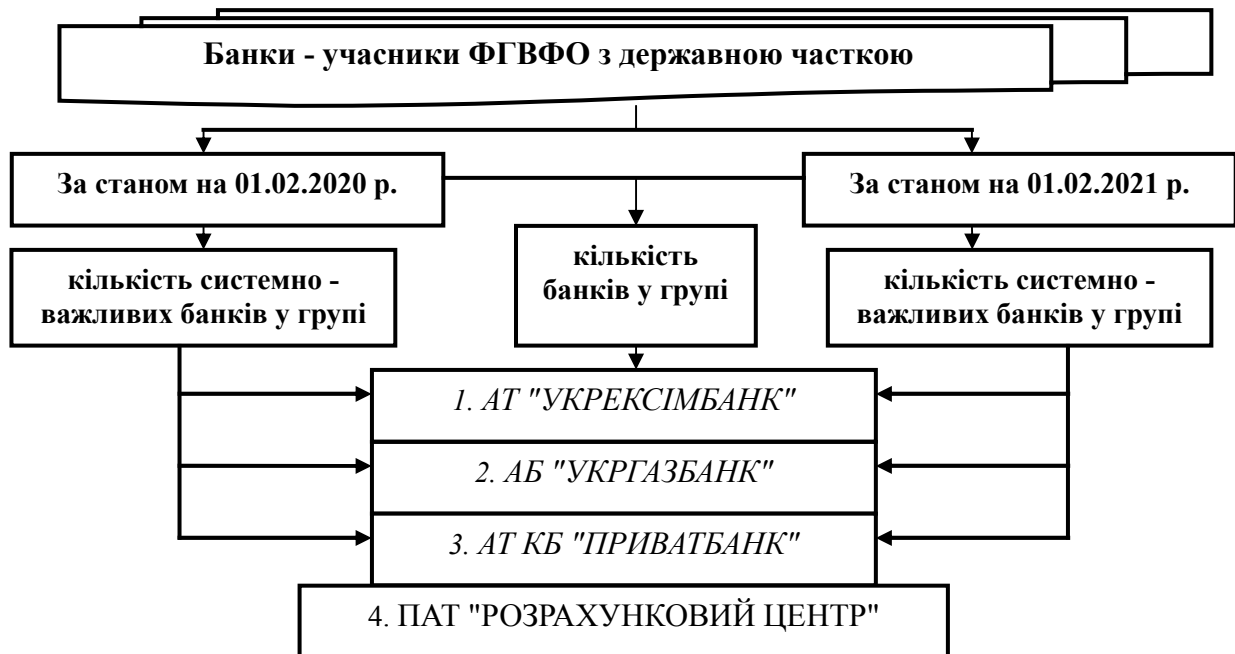
Рис. 1. Динаміка зміни кількості банків –учасників ФГВФО з державною часткою за 2020 – 2021 рр.

Для проведення комплексного аналізу здійснюють розподіл банків України на групи (рис. 1, 2, 3).