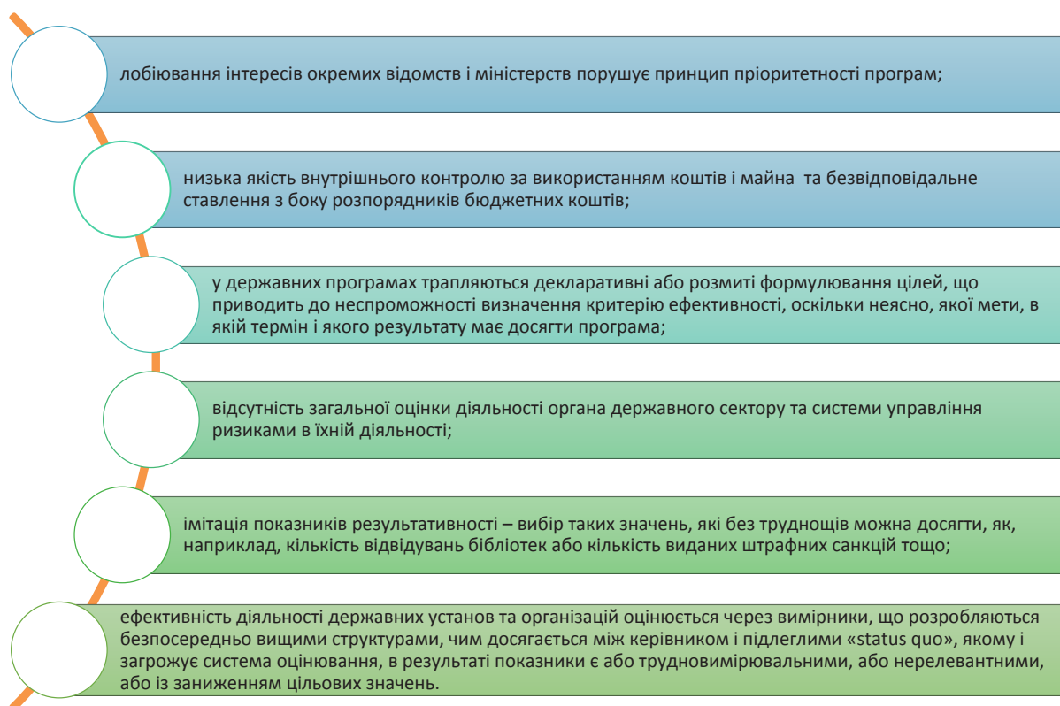
Рис. 4. Проблеми неефективного використання бюджетних коштів [11, 12]