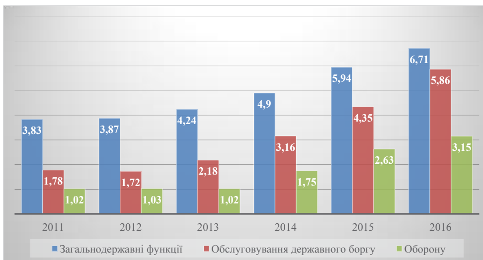
Рис. 2. Динаміка показників видатків Зведеного бюджету України, % до ВВП