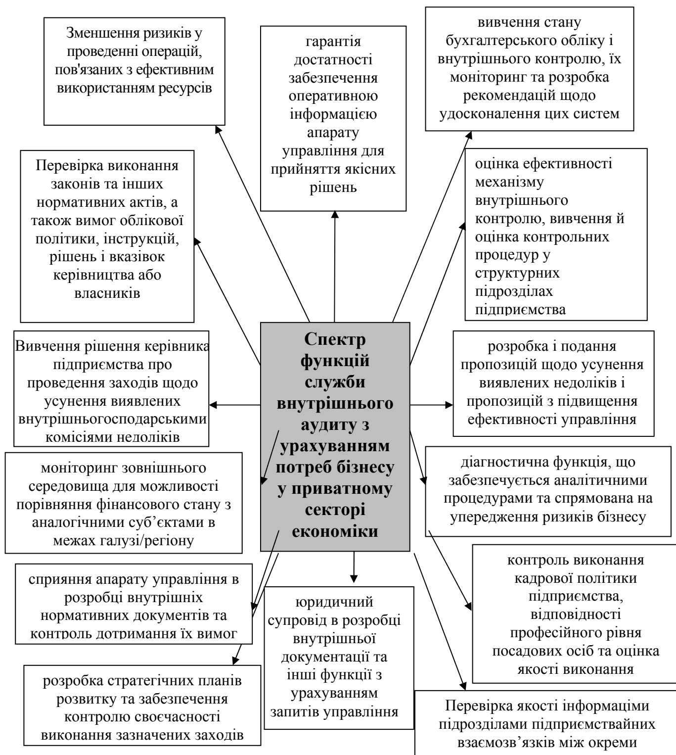
Рис 2. Функцій служби внутрішнього аудиту

контроль) [3, с 428], тому в даному дослідженні деталізовано лише функції, які покликаний виконувати внутрішній аудит для цілей управління.