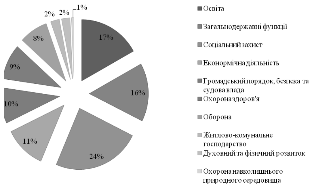
Рис. 2. Склад і структура видатків Зведеного бюджету України в розрізі функціональної класифікації за 2018 рр., %

Останніми роками спостерігається збільшення видатків Зведеного бюджету України на загальнодержавні функції, обслуговування державного боргу та оборону. На рис.2 відображено структуру видатків Зведеного бюджету України в розрізі функціональної класифікації (рис. 2).