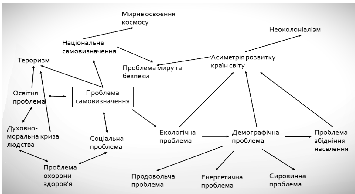
Рис. 1. Зв'язок глобальної проблеми самовизначення з іншими проблемами

Демографічний бум призводить до продовольчої проблеми, тобто до неможливості забезпечити кожному індивіду доступ до продуктів харчування, необхідний для його нормального функціонування. Зі збільшенням кількості світового населення ми все частіше зустрічаємось з проблемами вичерпання ресурсів (ресурсна проблема), проблемою нестачі енергоресурсів (енергетична проблема) та з проблемою збідніння населення. Хоча, з іншого боку, ріст населення, а отже і ріст робочої сили, мали б призвести до збільшення виробництва, покращення економіки країни, збагачення нації. Сировинна проблема у цьому випадку нікуди не зникає, проте продовольча, енергетична проблеми та проблема збідніння населення мали б знайти своє логічне вирішення.