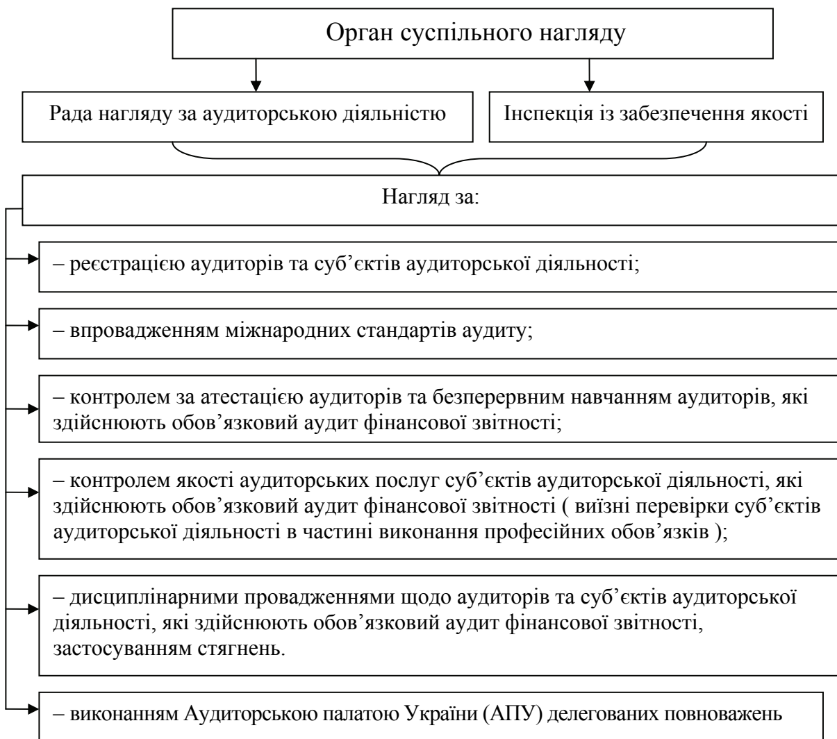
Рис. 1. Функції органу суспільного нагляду

Новий Закон України «Про аудит фінансової звітності та аудиторську діяльність» вступає в силу з 01.10.2018 року [1]. Цей Закон встановлює нові правила контролю якості аудиторських послуг окремо для аудиторських фірм, що перевіряють фінансову звітність суб'єктів суспільного інтересу, окремо для інших суб'єктів господарювання. Контроль якості аудиту фінансової звітності суб'єктів суспільного інтересу проводить орган суспільного нагляду, функції якого представлені на рис. 1.