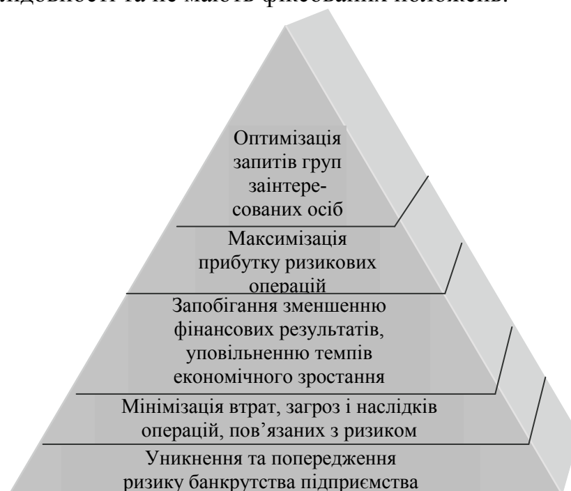
Рис. 3. Ієрархічна модель завдань економічного аналізу ризиків інвестиційної діяльності

Використовуючи теорію ієрархії потреб (піраміда А. Маслоу), нами сформовано ієрархічну модель завдань економічного аналізу інвестиційної діяльності, яка передбачає, що у міру виконання базових завдань (найнижчий рівень піраміди) підвищується актуальність завдань більш високого рівня – тільки тоді, коли аналітиком (менеджером, економістом) буде отримана впевненість у відсутності ризику банкрутства, будуть вирішуватись завдання з мінімізації витрат та максимізації фінансових результатів. Чітке розмежування завдань, відображене на ілюстрації, є умовним, усі завдання перебувають у нерозривній послідовності та не мають фіксованих положень.