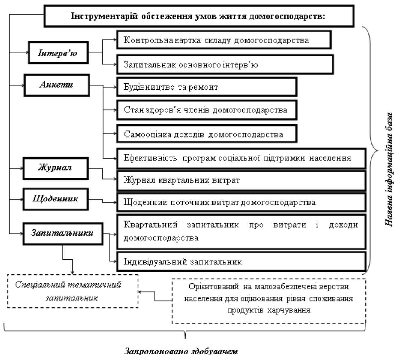
Рис. 3. Інформаційні ресурси обстеження умов життя домогосподарств

Інформаційні ресурси ОУЖД, зокрема запропонований запитальник, узагальнено на рис. 3.