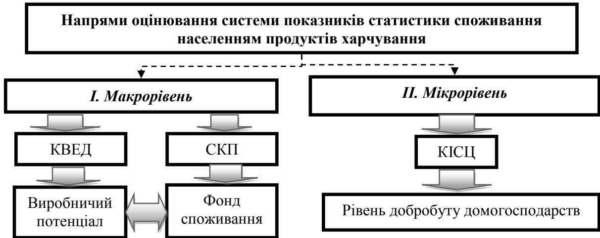
Рис. 1. Підхід до вивчення показників статистики споживання населенням продуктів харчування на макро- та мікрорівнях

Запропоновано вивчати показники статистики споживання населення України на макро- та мікрорівнях. Систематизація показників статистики споживання продуктів харчування населенням України дозволила побудувати таку схему (рис. 1).