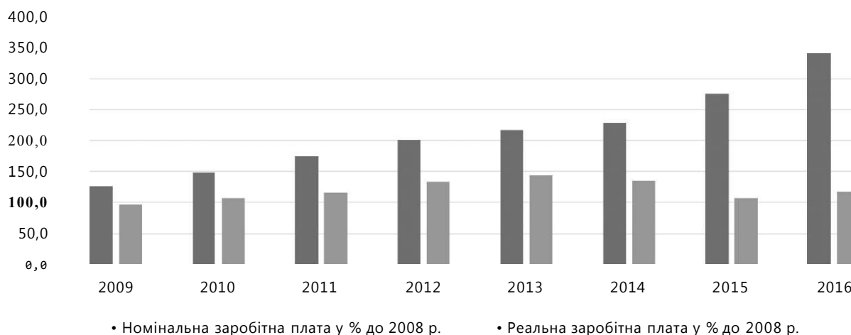
Рис. 1. Темпи зростання номінальної та реальної заробітної плати в Україні за 2009-2016 рр. (до 2008 року, %)

Основним джерелом доходів населення традиційно виступає заробітна плата, аналіз якої проводиться за видами - номінальною та реальною. Аналіз номінальної заробітної плати дає змогу оцінити загальну суму коштів, що виплачується за результати трудової діяльності, а також порівняти її з іншими показниками поточного року; аналіз реальної заробітної плати дозволяє встановити купівельну спроможність грошей [5]. На рис. 1 представлено співвідношення між номінальною та реальною заробітною платою в Україні.