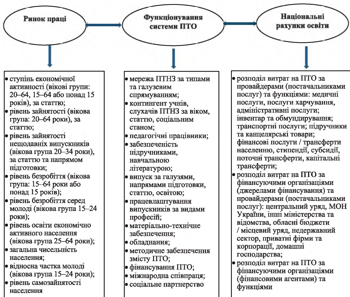
Рис. 1. Статистичні показники ПТО

Постає логічне запитання: чи задовольняє користувачів існуюча статистична інформація? Скористуємося для відповіді на це запитання даними