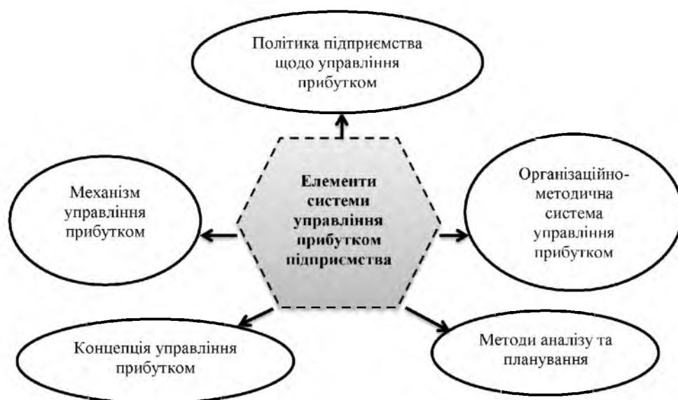
Рис. 2. Складові елементи системи управління прибутком підприємства

Грунтуючись на різноманітних підходах вчених можна виділити такі елементи системи управління прибутком підприємств (рис. 2).