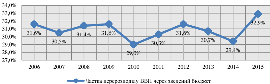
Рис. 1. Частка перерозподілу ВВП через зведений бюджет України [24]

Загалом частка перерозподілу ВВП через зведений бюджет України коливається в межах 30% з деяким зниженням у кризові періоди 2010 та 2014 рр.