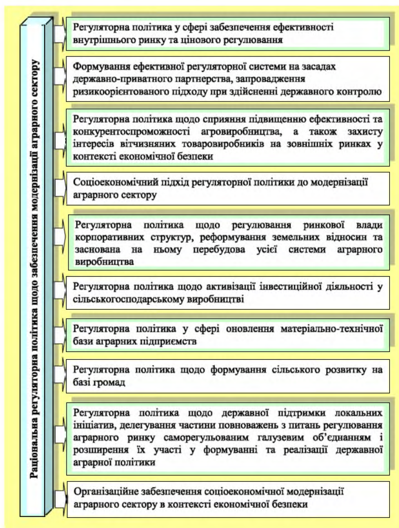
Рис. 1. Напрями формування раціональної регуляторної політики аграрного сектору економіки

Узагальнимо пріоритетні напрями формування раціональної регуляторної політики для аграрного сектору економіки, які сприятимуть забезпеченню його модернізації та гарантуванню економічної безпеки (рис. 1), та їх розглянемо детальніше.