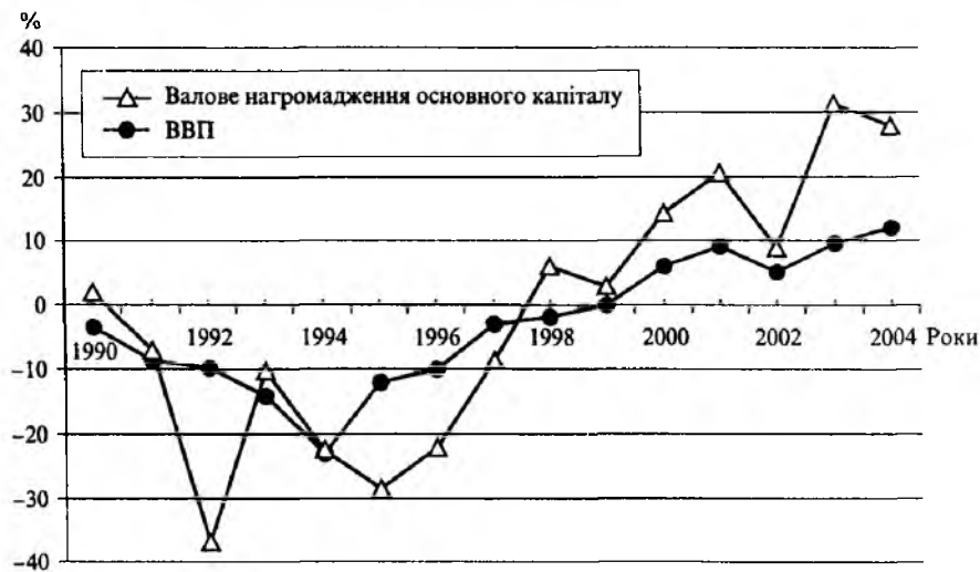
Рис. 1. Темпи щорічної зміни економічних показників в Україні

Організаційно-економічний механізм управління національною макросистемою вирішує глобальне питання пошуку альтернативи перерозподілові обмежених ресурсів з метою підпорядкування економічного зростання розвитку. За обраною нами аналогією, узагальнена діалектична залежність цих альтернатив має вигляд проблеми вибору пріоритетного напрямку вкладення коштів: або в паливо для здійснення руху, або в удосконалення того механізму, який забезпечує проходження. Вплив економічного зростання на розвиток виявляється у якісних змінах, параметри яких в умовах української економіки слід оцінювати з огляду на необхідність усунути ряд негативних явищ принципового характеру. Вони полягають у тому, що: