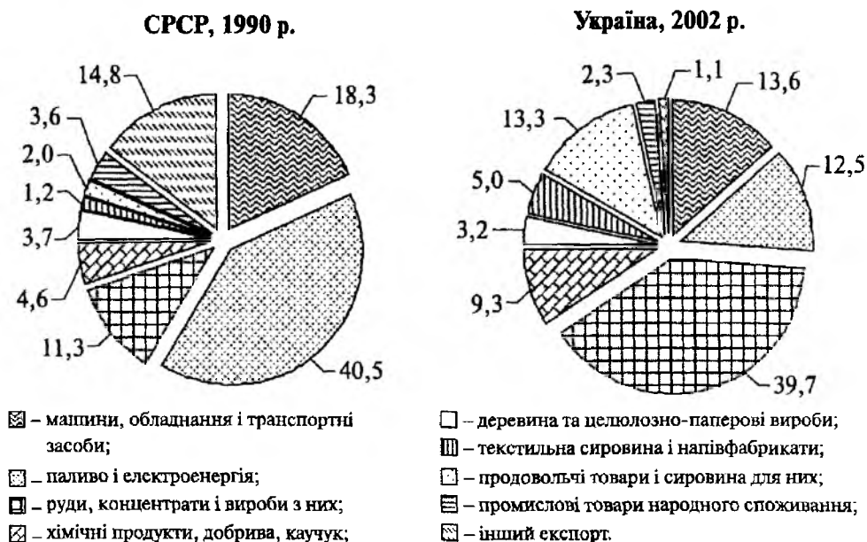
Рис. 3. Структура експорту СРСР і України, %

вив паливно-енергетичний комплекс, то в Україні – металургійний. У 2002 р. з України було експортовано неблагородних металів та виробів з них на суму 7129 млн дол. США, що становить понад 91 % загального обсягу продукції чорної металургії, тобто можна стверджувати, що ця галузь працює на обслуговування зовнішнього ринку. Слід також відзначити, що в структурі імпорту України переважають мінеральні продукти – 41,5 %, тобто експорт металу здійснюється за рахунок імпорту енергоносіїв. Таким чином, через продукцію металургійної галузі відбувається реекспорт енергоносіїв. До того ж, рентабельність деяких видів продукції чорної металургії є низькою (чавун – 4,8 %) чи навіть від’ємною (сталь і мартенівська сталь) 3 .