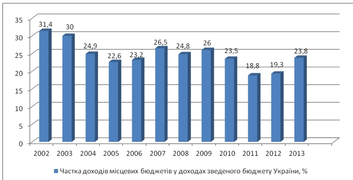
Рис. 1 Доходи місцевих бюджетів України (без урахування офіційних трансфертів) у зведеному бюджеті, %